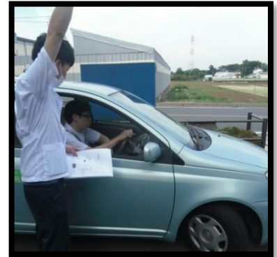
実際の車に乗ってハンドル操作等の確認を行います。