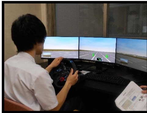
ドライブシミュレーターを使用します。