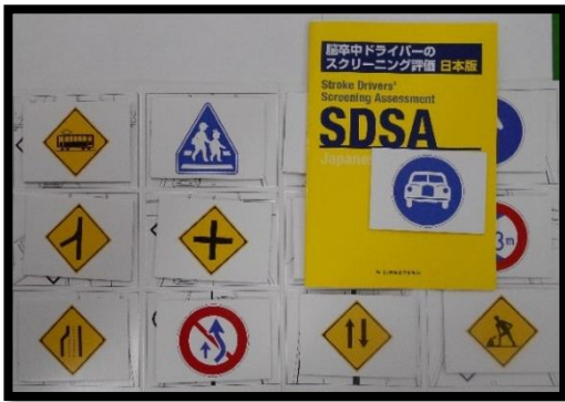
運転に関する高次脳機能検査を行います。