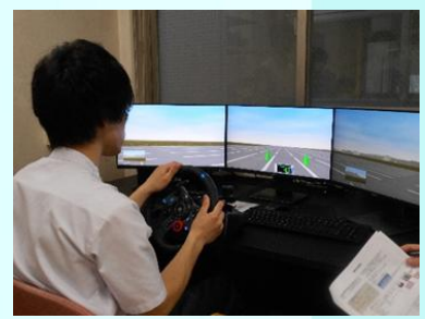
ドライブシュミレーター