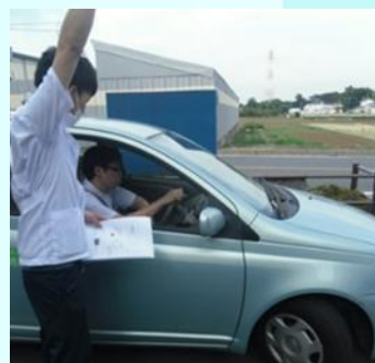
実際の車に乗ってハンドル操作等の確認することも可能です。 ※別途費用がかかります。

◎病後の自動車運転に悩んでいる患者さまはいらっしゃいませんか？当院では脳卒中等の患者さまへ自動車運転支援を行っています。 ご希望の患者さまがいらっしゃいましたら、ご相談ください。