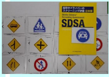
運転に関する高次機能検査

【電車をご利用の場合】 東武東上線 ふじみ野駅下車 バス：西口ライフバス停 「埼玉セントラル病院前」下車 ※無料送迎バスあり